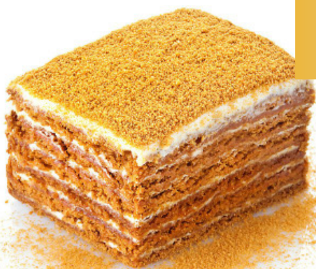
Медовик 100 гр 60 РУБ