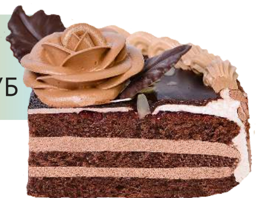
Прага 100 гр 60 РУБ