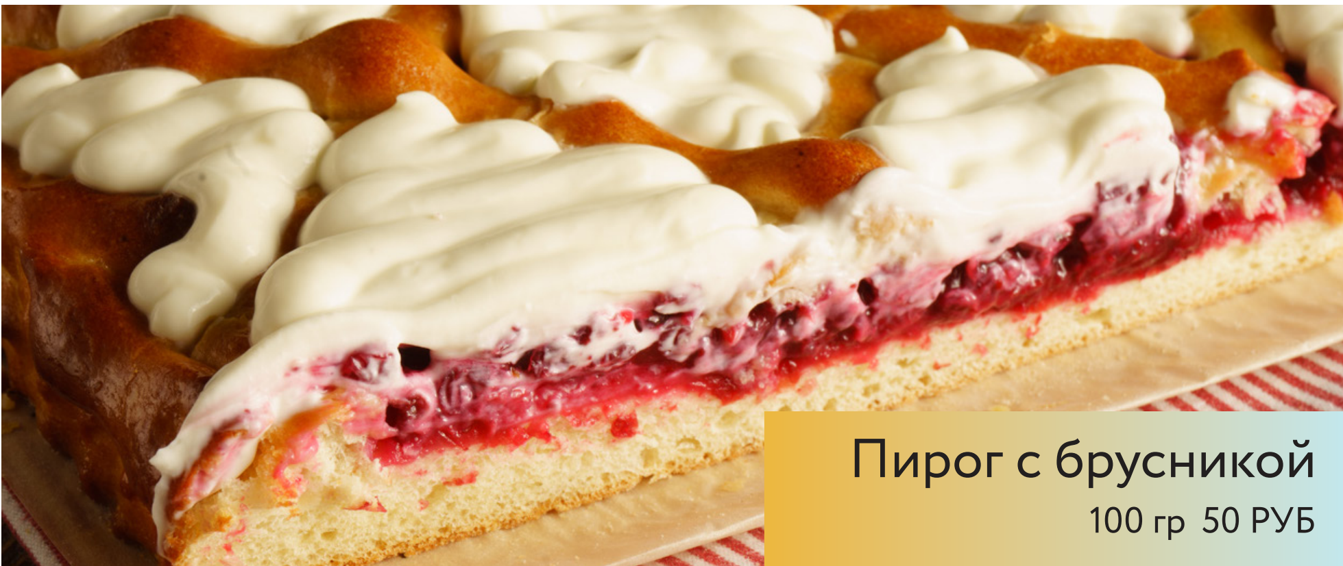
Пирог с брусникой 100 гр 50 РУБ