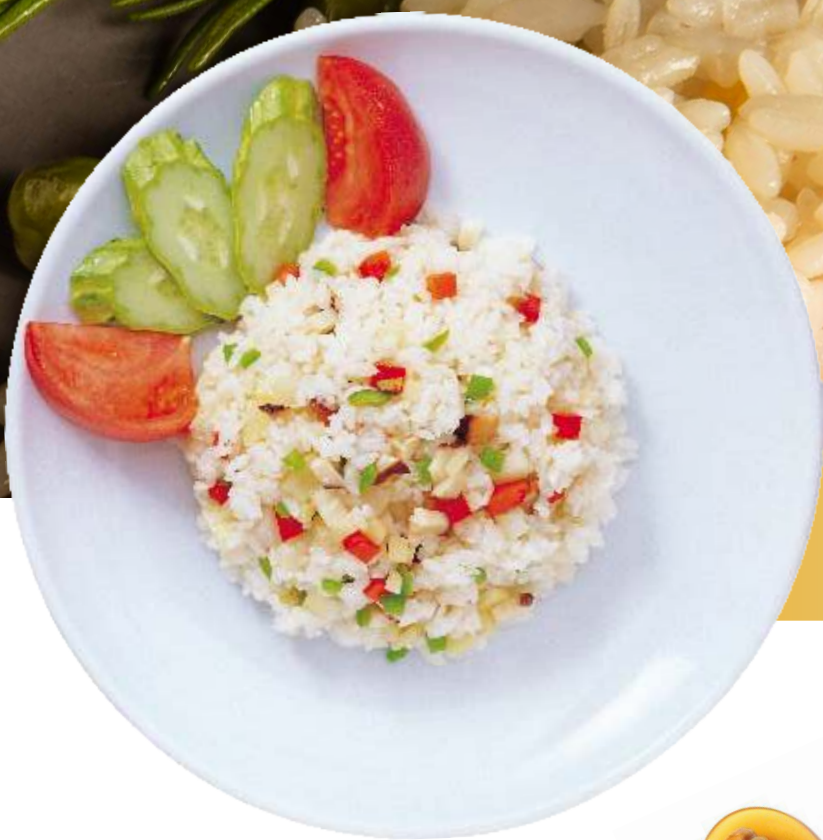
Рис с овощами