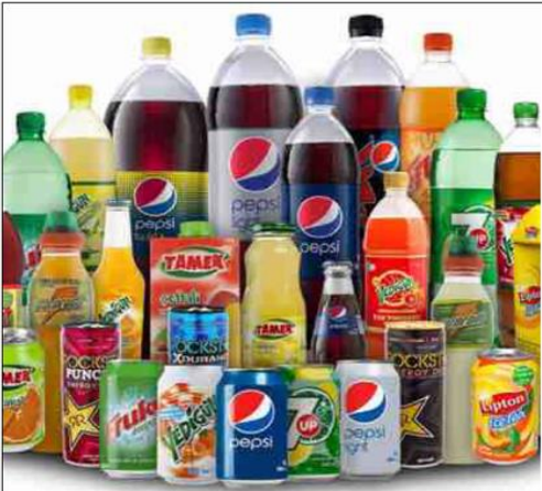
مشروبات متنوعة من اختيارك