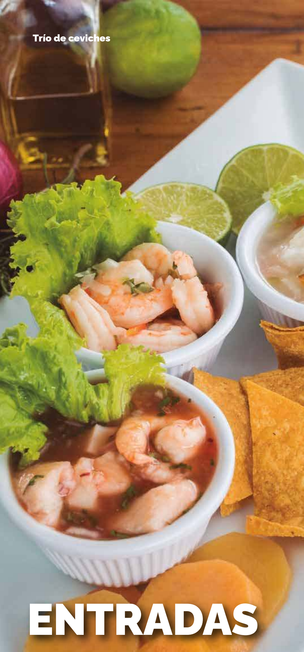
Trío de ceviches