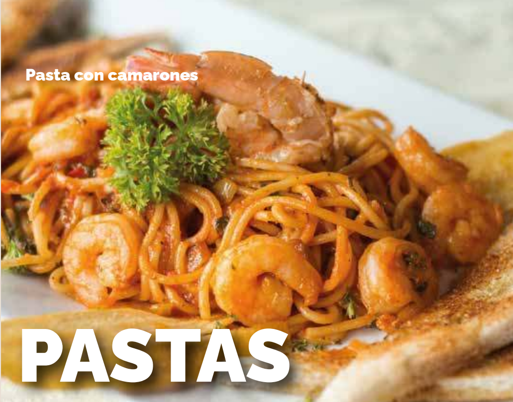
Pasta con camarones