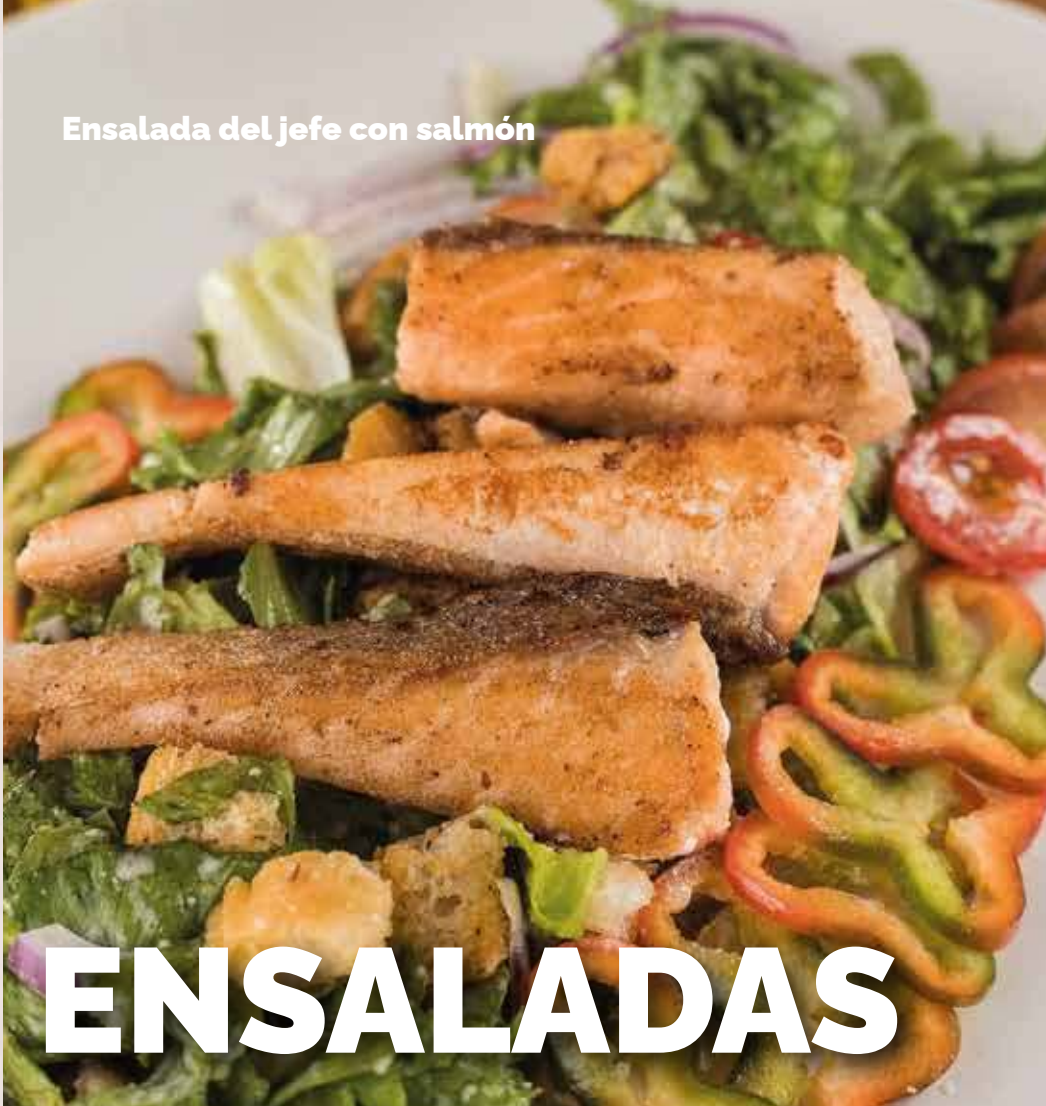
Ensalada del jefe con salmón