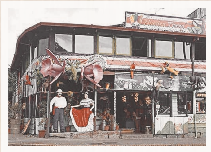
Restaurante Nuestra Tierra. Av 2 calle 15, San José

Hace más de 20 años, se cumplió el sueño de traer lo mejor de la cocina y cultura tica al corazón de la ciudad: la capital.