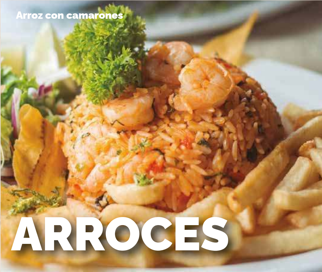
Arroz con camarones