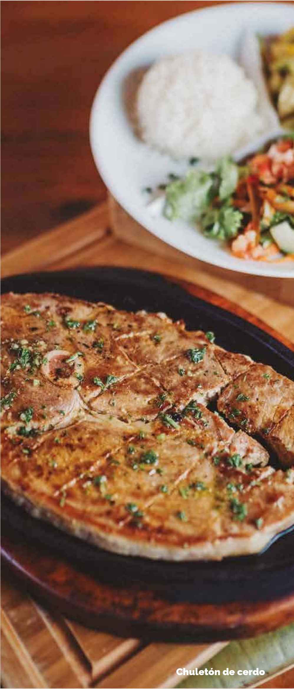
Chuletón de cerdo