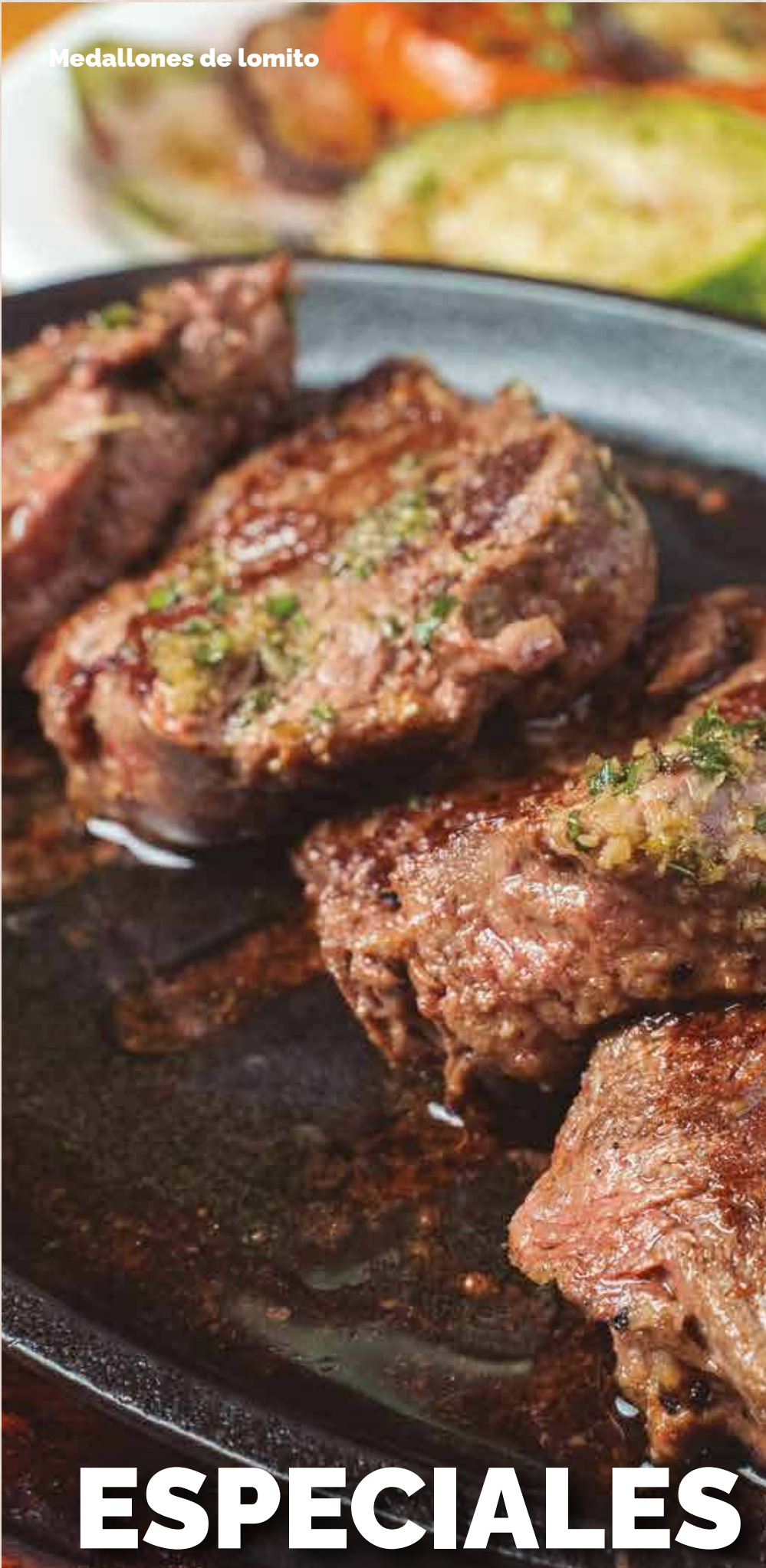
Medallones de lomo