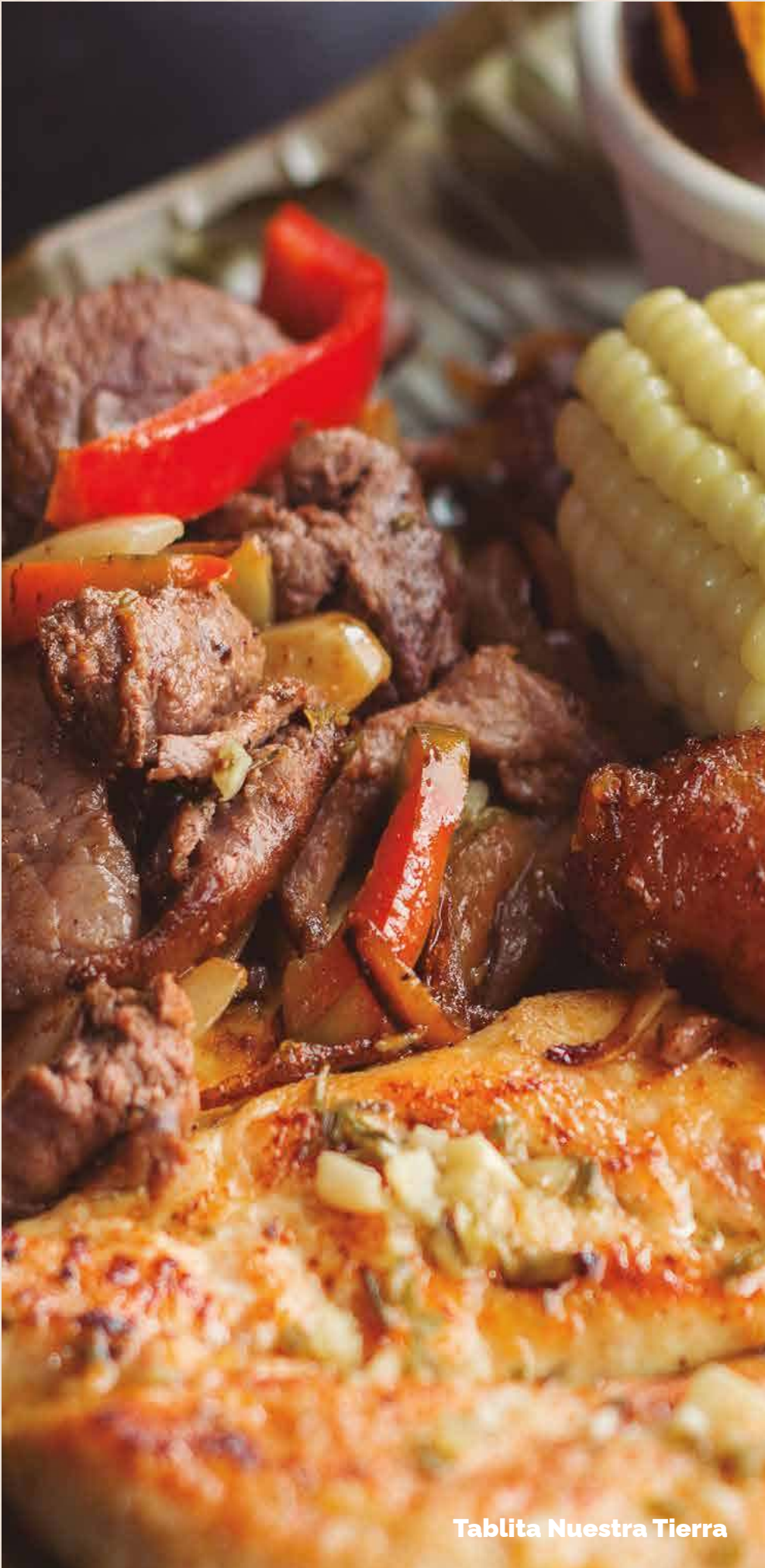
Tablita Nuestra Tierra