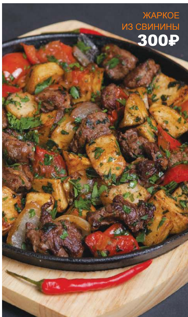
ЖАРКОЕ ИЗ СВИНИНЫ 300₽