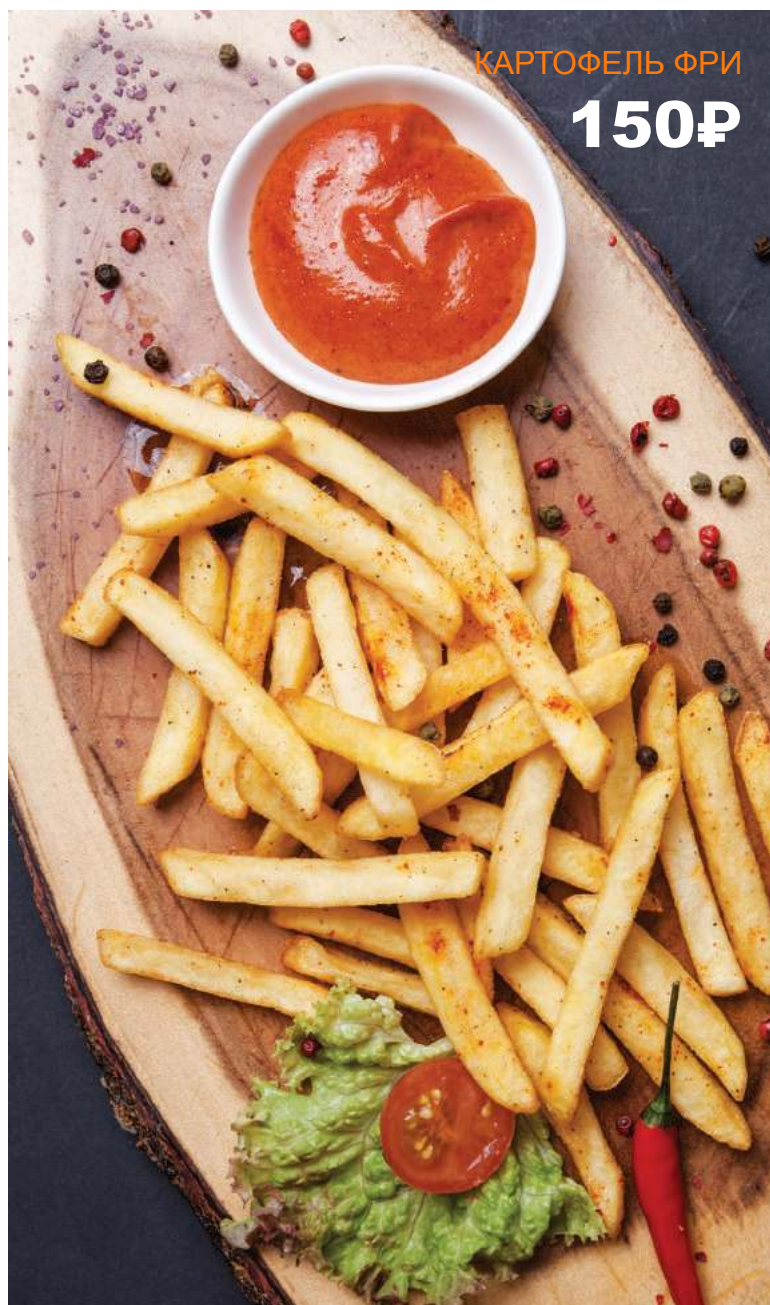
КАРТОФЕЛЬ ФРИ 150₽