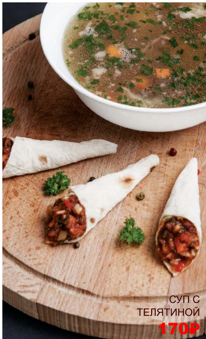
СУП С ТЕЛЯТИНОЙ 170Р