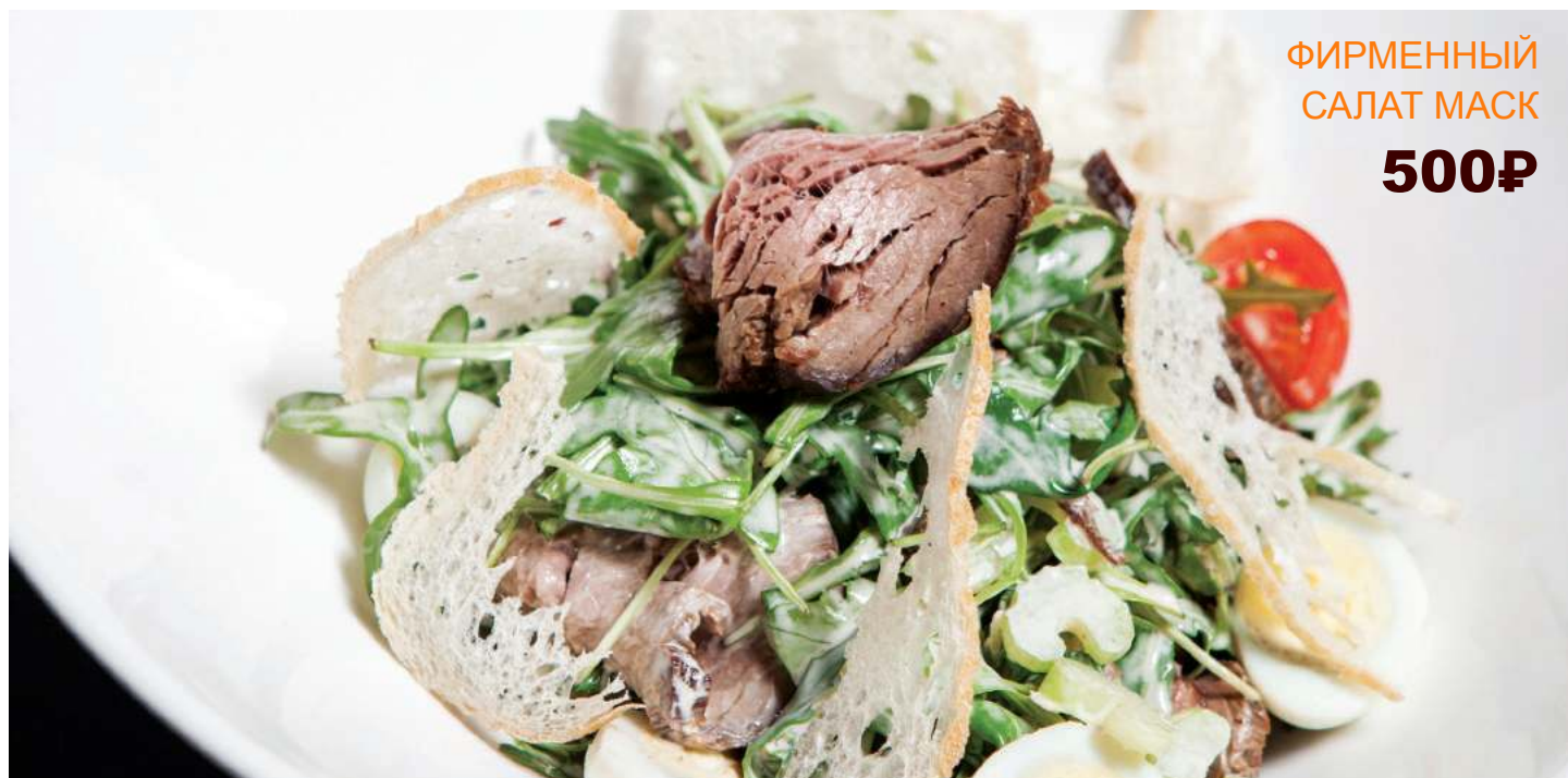
ФИРМЕННЫЙ САЛАТ МАСК 500Р

Филе индейки, микс салата, апельсин, соус брусничный, орех кедровый, 200гр