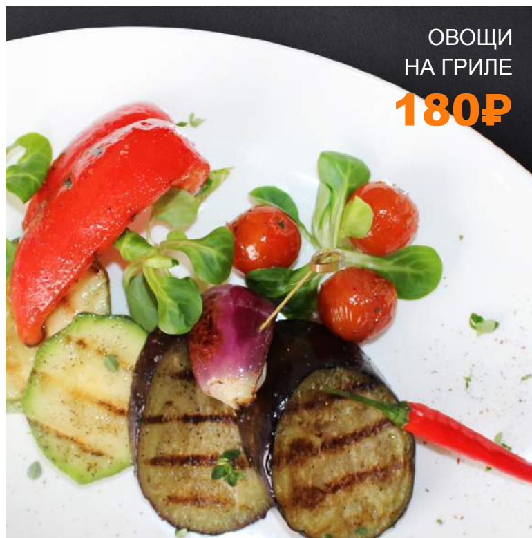
ОВОЩИ НА ГРИЛЕ 180₽