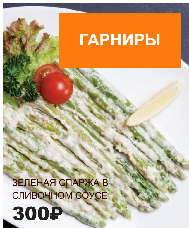
ЗЕЛЕНАЯ СПАРЖА В СЛИВОЧНОМ СОУСЕ