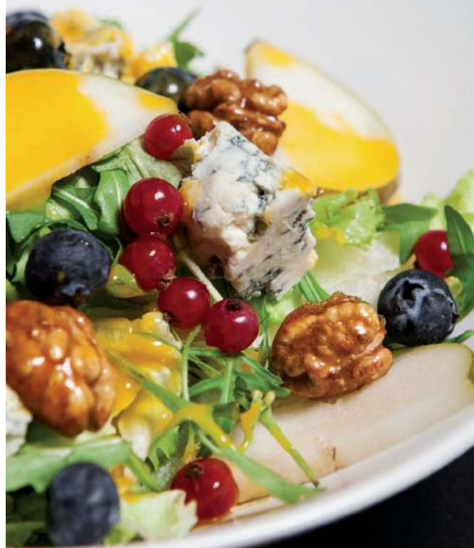
САЛАТ С ГРУШЕЙ И КАРАМЕЛИЗОВАННЫМИ ОРЕШКАМИ 350Р