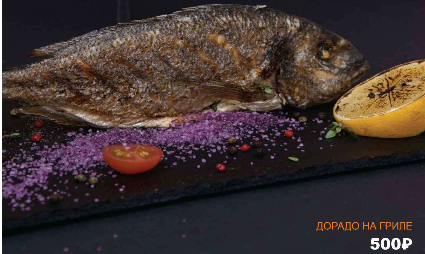
ДОРАДО НА ГРИЛЕ