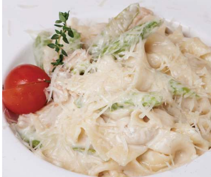
ФЕТУЧИНИ С ИНДЕЙКОЙ И ЗЕЛЕННОЙ СПАРЖЕЙ