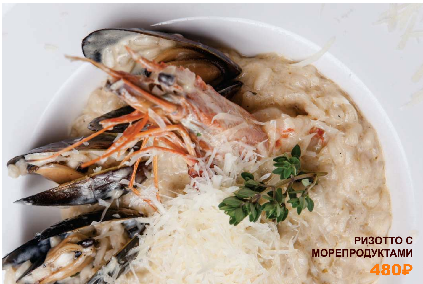
РИЗОТТО С МОРЕПРОДУКТАМИ