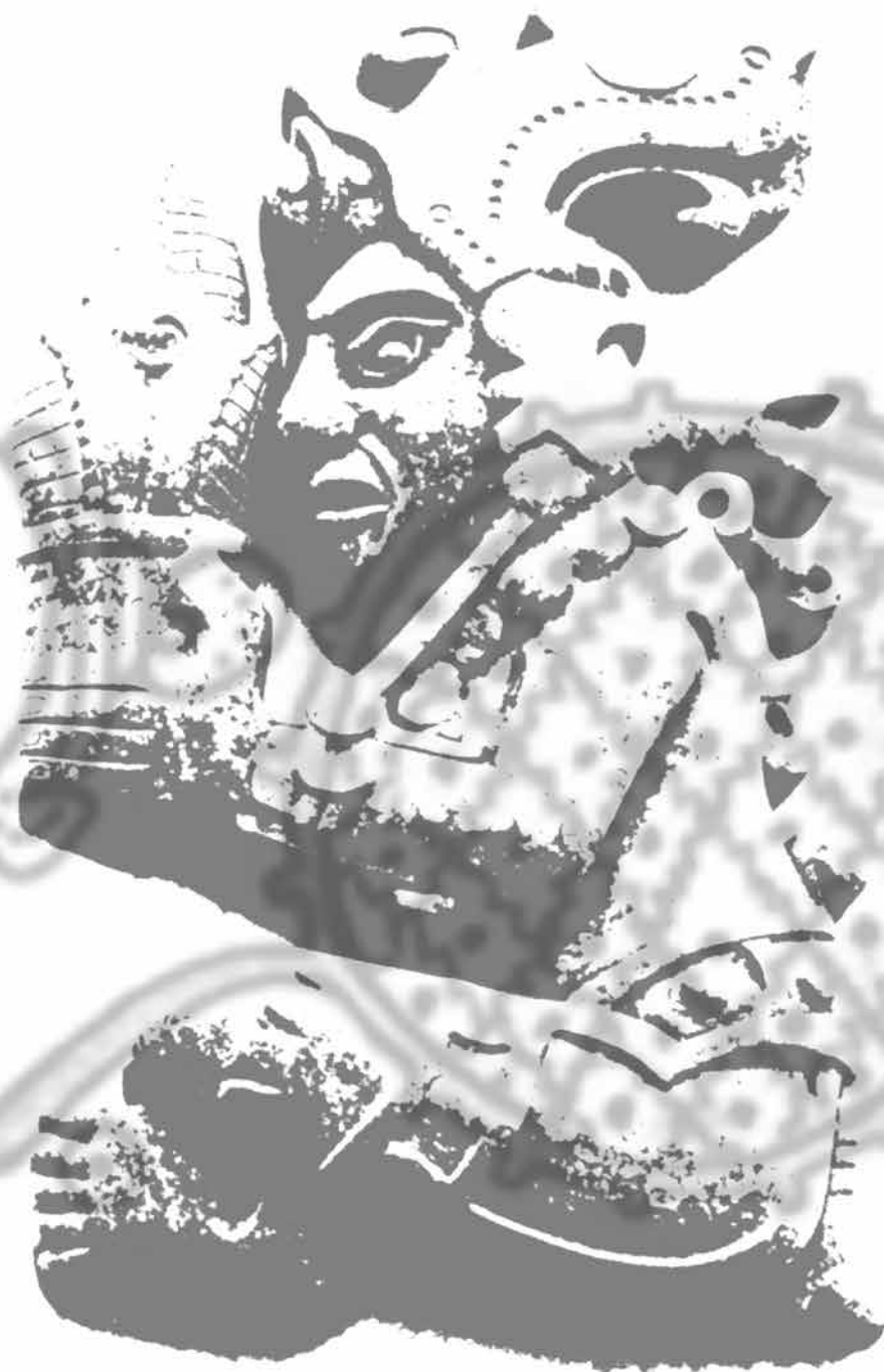
YUUMI KAX, DIOS MAYA LIGADO A LA AGRICULTURA Y EL MONTE