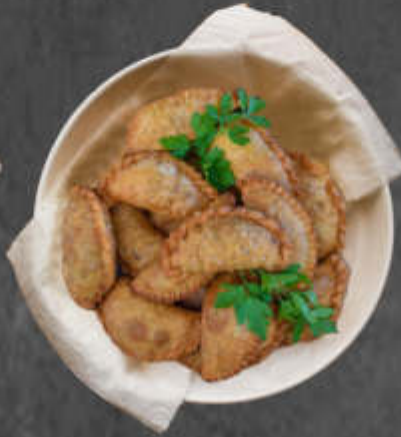
À LA VIANDE 6.50€