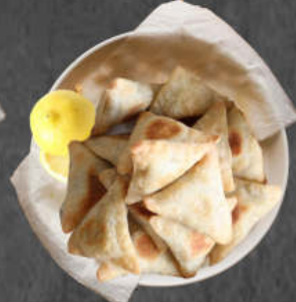
AU ÉPINARD 5.50€