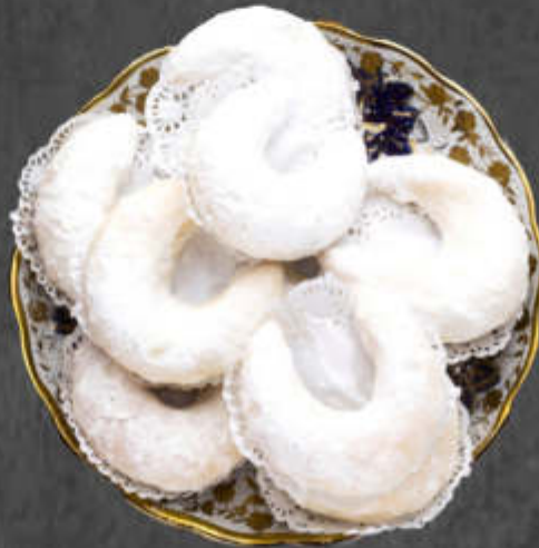
Corne de Gazelle 3€