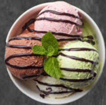
Glace Chocolat/Fraise/Mangue/ Pistache/Amarena Fabri/ Panna Cota/Café/ Vanille-Noix de Macadamia