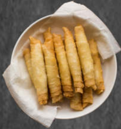
AU FROMAGE 6€