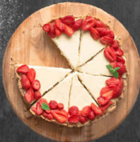
Cheese Cake 1pcs 5€