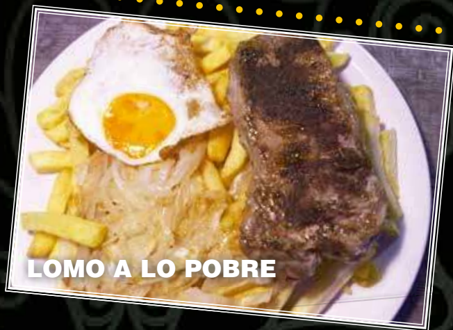
LOMO A LO POBRE