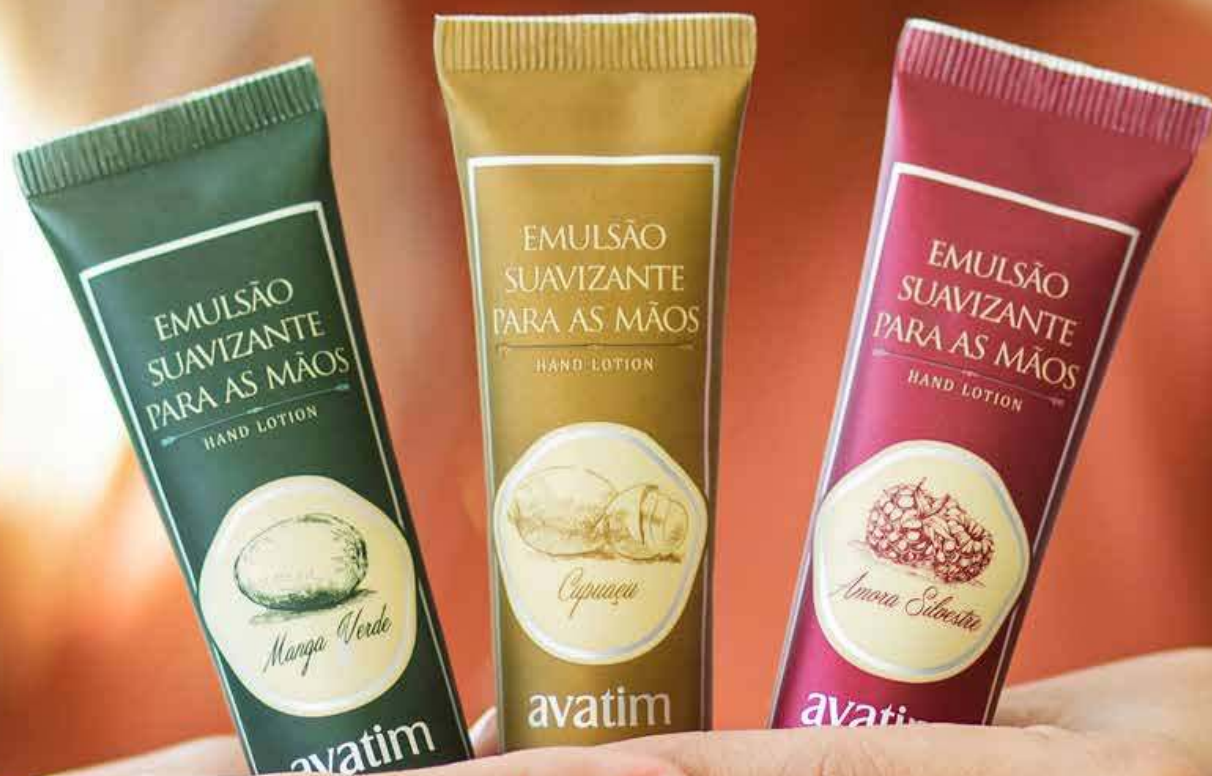
Emulsão suavizante para as mãos 50 g Fragrâncias: Cupuaçu | Amora Silvestre | Manga Verde