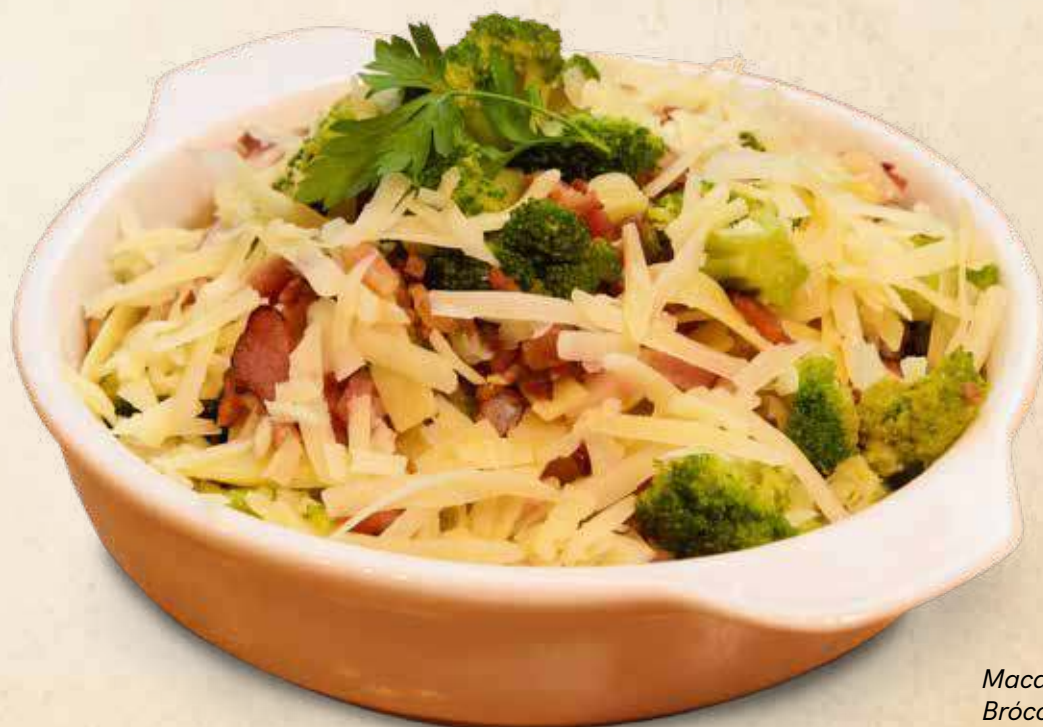
Macarrão Alameda Brócolis com bacon