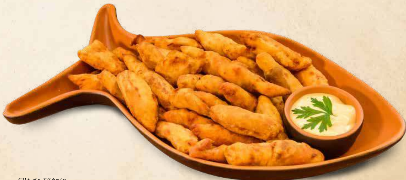
Filé de Tilápia