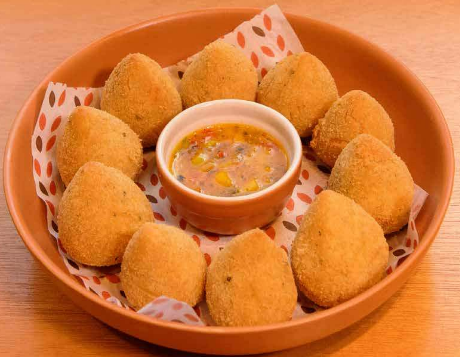
Coxinha de Frango