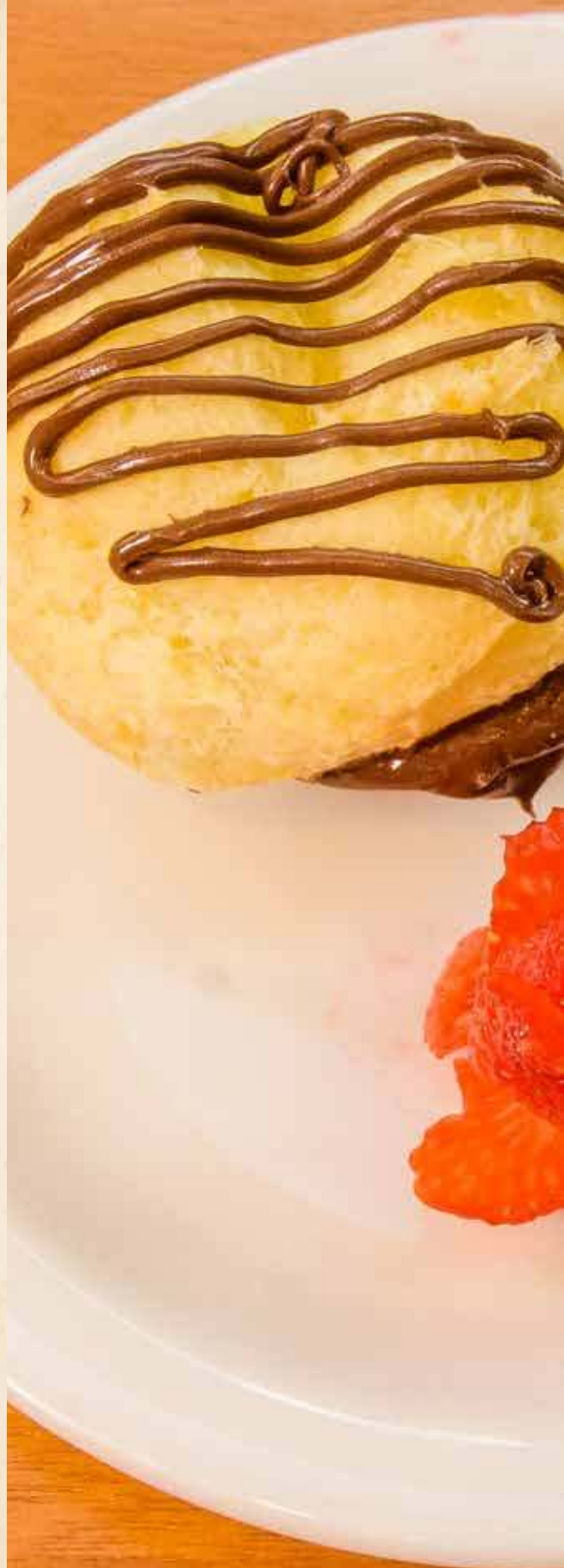
Pão de queijo com Nutella