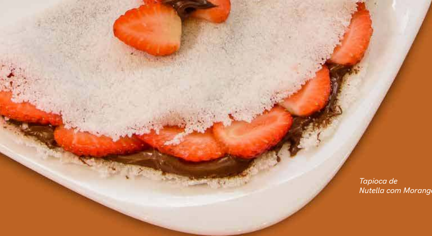
Tapioca de Nutella com Morango