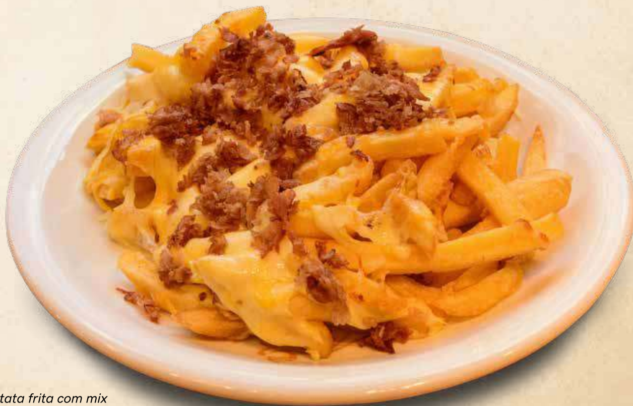
Batata frita com mix de queijo e bacon

Aperitivo Peito de Peru _____ R$ 35,00 (peito de peru, tomate, cheiro verde e cebola 10 unidades de 35g cada)