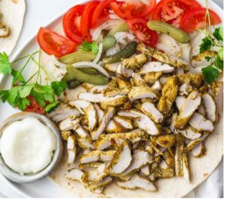
RC - 01 شورما SHAWARMA