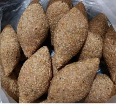
RC - 05 كبه للقلي FRYING KIBBEH