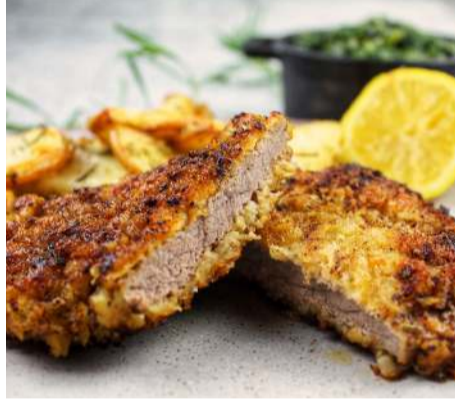
RC - 04 اسكالوب ESCALOPE