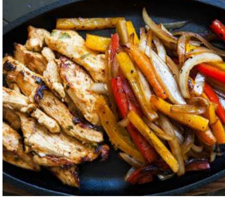
RC - 02 فاهيتا FAJITA