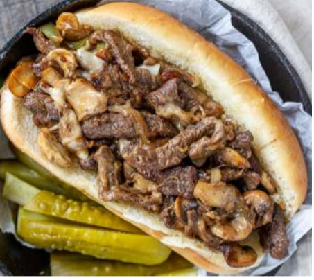
RC - 03 فيلادلفيا PHILADELPHIA