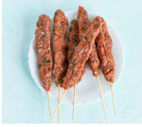
RC - 06 كفتة مشكلة KUFTA MIX