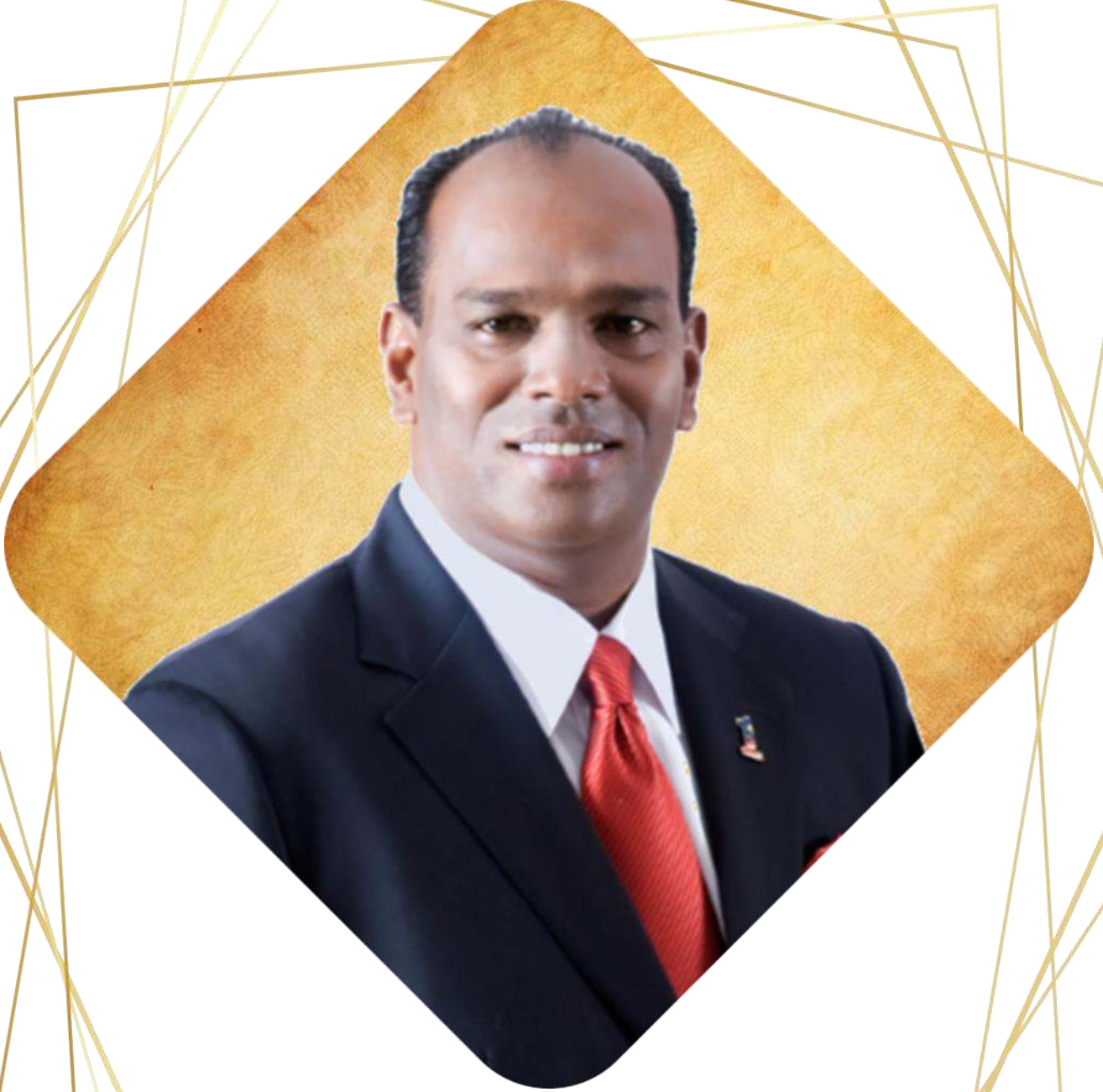
மாண்புமிகு டத்தோ ஸ்ரீ எம். சரவணன் மலேசியாவின் மனித வள அமைச்சர் YBHG. DATUK SERI M. SARAVANAN MENTERI SUMBER MANUSIA