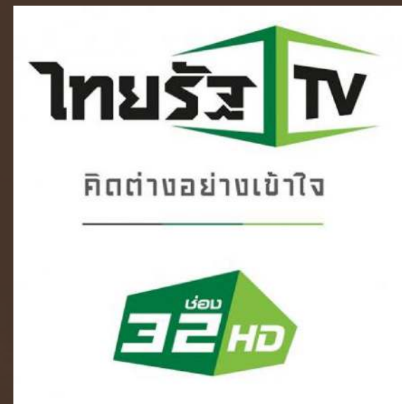
ไทยรัฐ TV 32