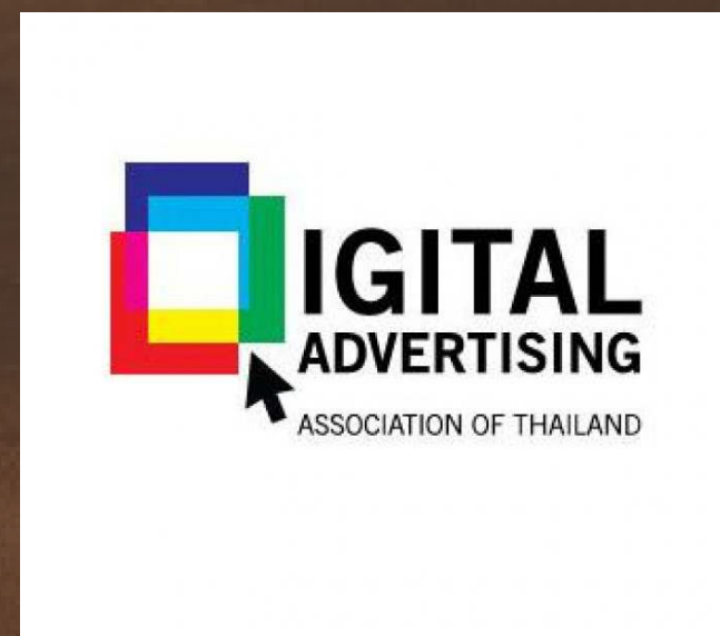
สมาคมโฆษณาดิจิทัล [ประเทศไทย]