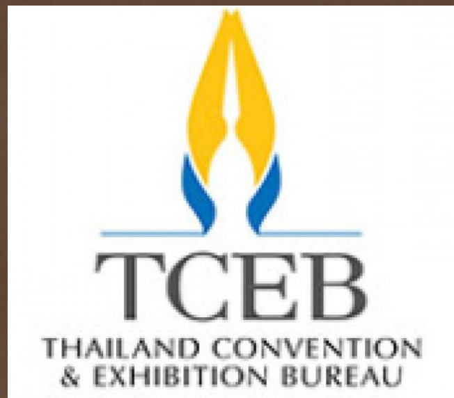
สำนักงานส่งเสริม การจัดประชุมและนิทรรศการ