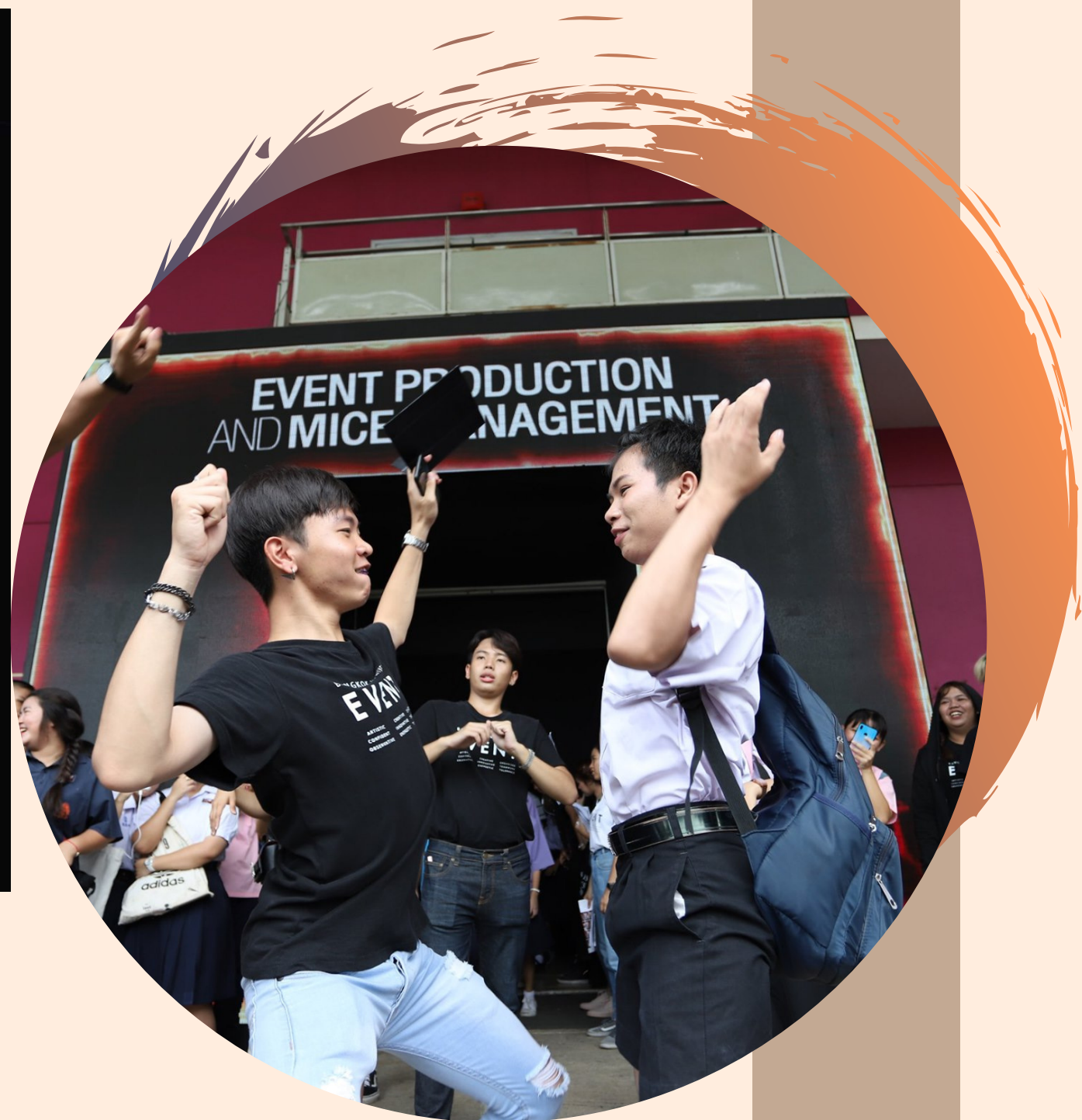
BU OPEN HOUSE & BANGKOK NIGHT