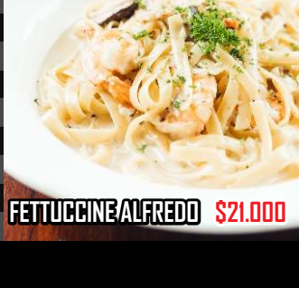
FETTUCINE ALFREDO $21.000

Fetuccine en salsa Alfredo, trozos de pollo y tocineta, almendras, tomates secos confitados, queso parmesano y albahaca