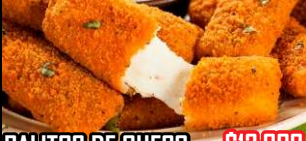
PALITOS DE QUESO $12.000

Palitos de Queso Apanados, acompañados con Miel