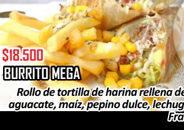
BURRITO MEGA $18.500

Rollo de tortilla de harina rellena de carne y pollo desmechado, chorizo campesino, tocineta, aguacate, maíz, pepino dulce, lechuga, pico de gallo, queso crema. Acompañado con papas a la francesa y salsas de la casa.