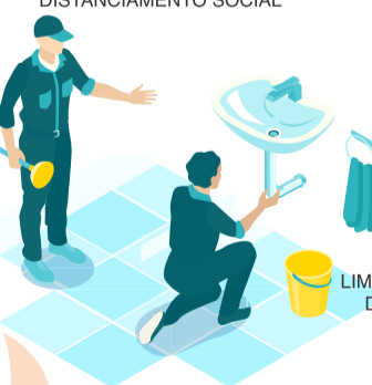
LIMPEZA DO AMBIENTE DE TRABALHO DE ACORDO COM ORIENTAÇÕES DA VIGILÂNCIA SANITÁRIA