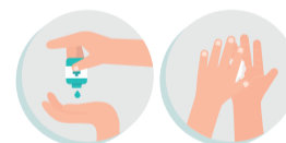
HIGIENE DAS MÃOS