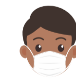
USO DE MÁSCARAS

ATENÇÃO: SERÁ COBRADO + 10% PELOS SERVIÇOS