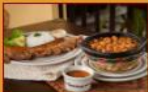
Frijoles con Chicharrón $35.000