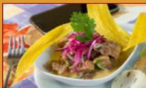
Ceviche de Chicharrón $23.000