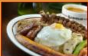
Bandeja Paisa $36.500