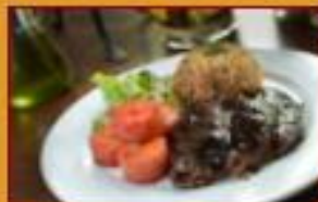
Posta Negra Cartagenera $47.000