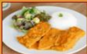
Lengua Alcaparrada $39.500