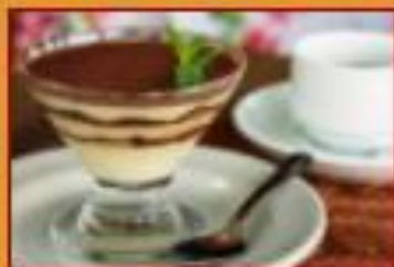
Postre de Milo $12.000