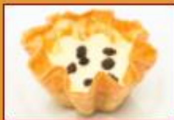
Postre de Natas $14.200