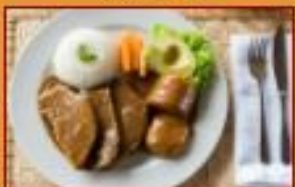
Lengua en salsa de Carne $39.500