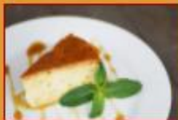
Flan de Leche $12.500