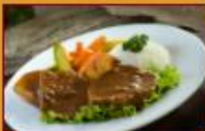
Sudado de Posta $36.000