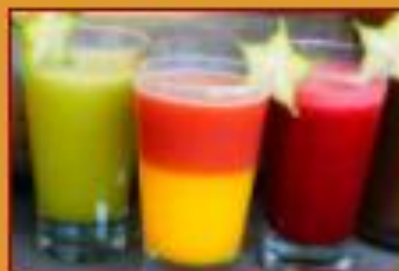
Jugos y Limonadas