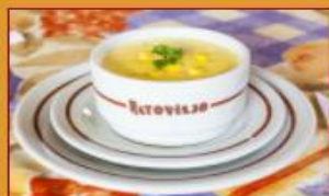
Crema de Maíz $14.500