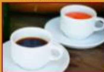
Cafés , Aromáticas y bebidas calientes