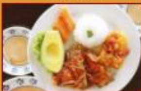
Sobrebarriga a la Criolla $40.500