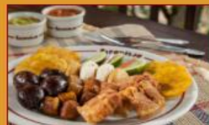
Entrada Típica $28.500