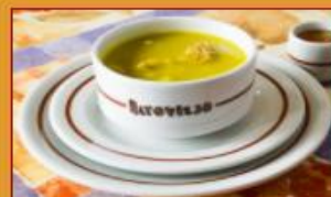
Sopa De Guineo $14.000