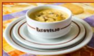
Crema de Champiñones $14.500