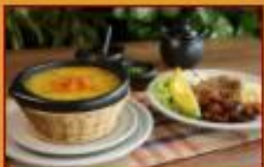
Sopa de Cura en Vereda $22.900