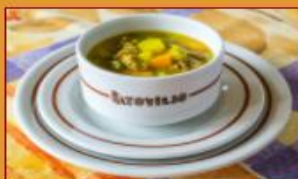
Sopa Campesina $14.000