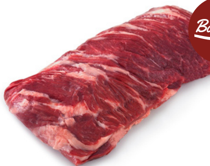
Cadera de res precio por libra $4,10