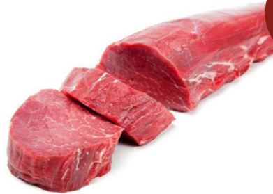
Picaña de res precio por libra $4,55