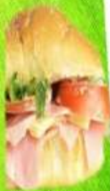
SANDWICH JAMON QUESO