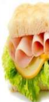
SANDWICH DE PAVO