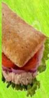
SANDWICH DE ATÚN