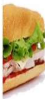
SANDWICH DE POLLO