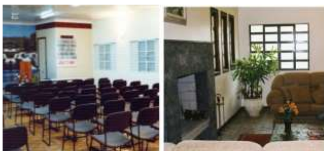
Audatório - Recepção