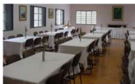
Cozinha e Refeitório