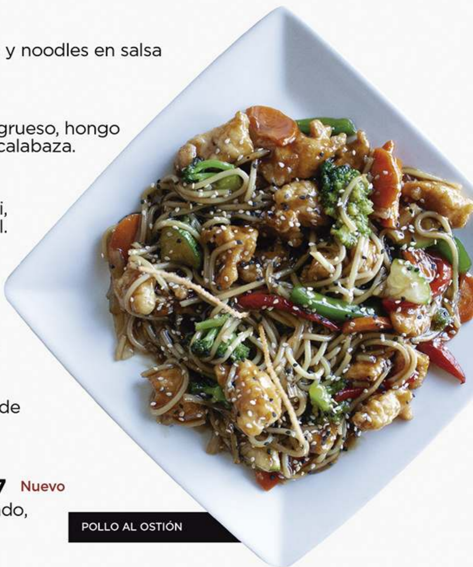
POLLO AL OSTIÓN

Palomitas de pollo empanizado, acompañadas de catsup, ideal para los peques.