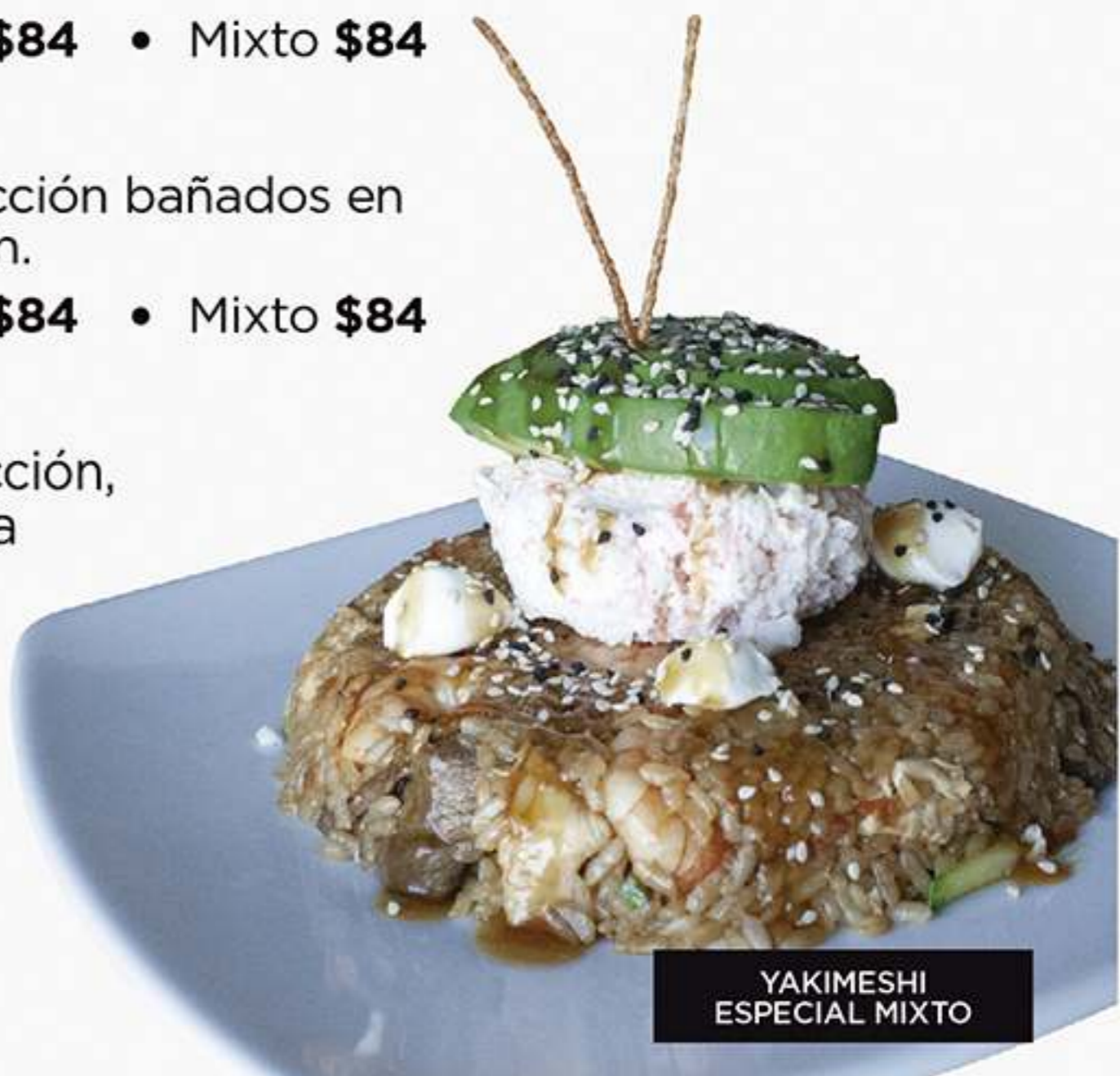
YAKIMESHI ESPECIAL MIXTO

Pollo capeado con pimientos, bañado en salsa agridulce, acompañado de gohan.