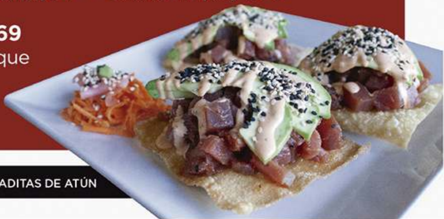
TOSTADITAS DE ATÚN