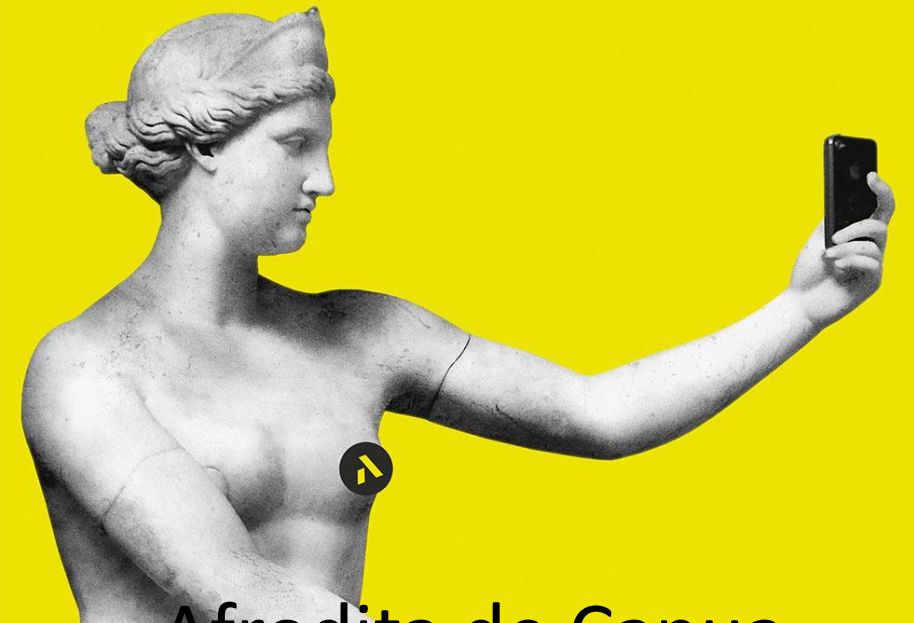
Afrodita de Capua