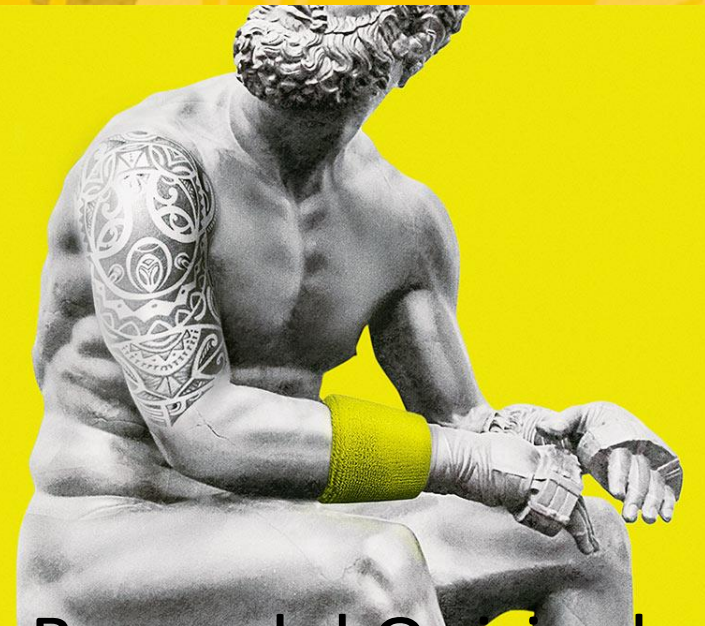
Boxer del Quirinal