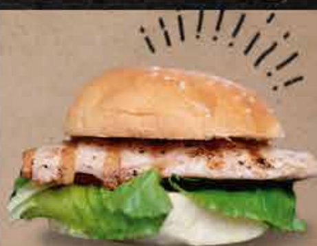
Grill $ 7,5