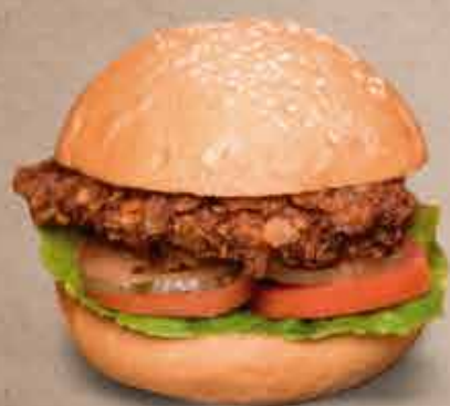
Crispy $ 8