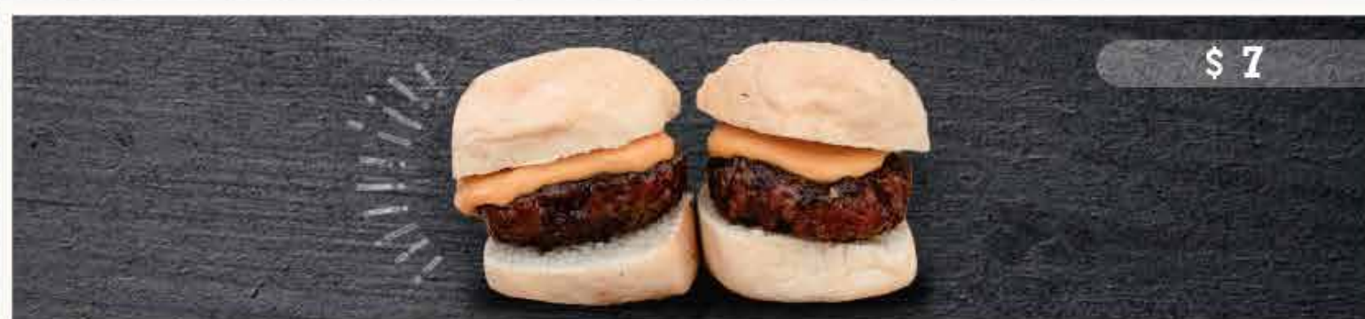
LOS VENADOS Dúo de mini Cheeseburgers