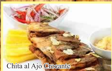
Chita al Ajo Crocante