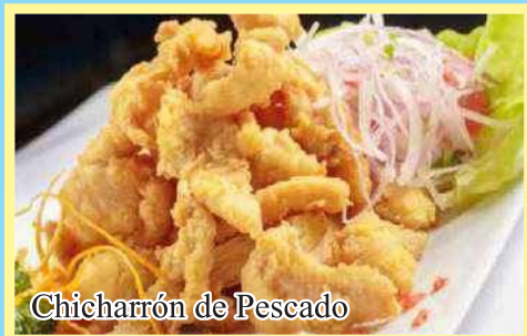
Chicharrón de Pescado