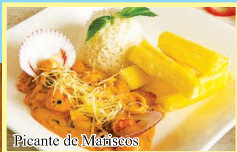
Picante de Mariscos