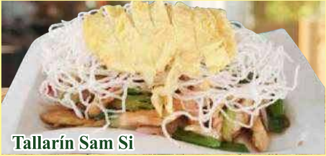
Tallarín Sam Si