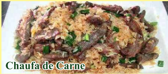
Chaufa de Carne