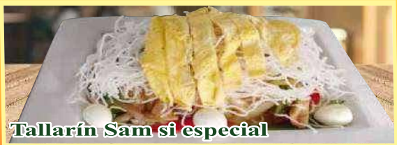
Tallarín Sam si especial