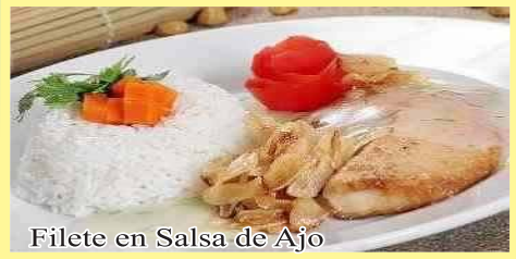
Filete en Salsa de Ajo

Filete de Pescado en su salsa al Ajo (Arroz blanco y yuca frita).