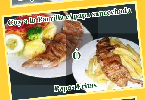
Cuy a la Parrilla c/ papa sancochada