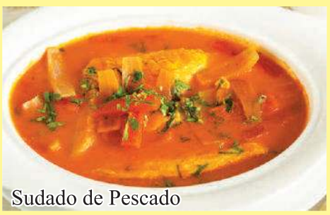
Sudado de Pescado