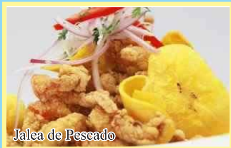
Jalea de Pescado