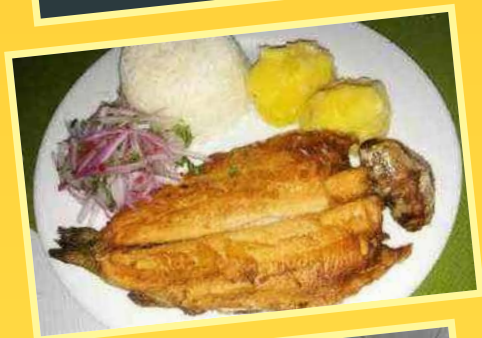
Trucha Frita (papas sancochada ó fritas + ensalada) (Todos los días)