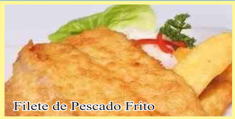
Filete de Pescado Frito

Filete a la milanesa (Arroz blanco y yuca frita).