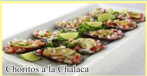
Choritos a la Chalaca