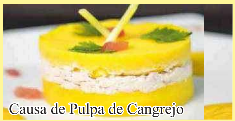
Causa de Pulpa de Cangrejo