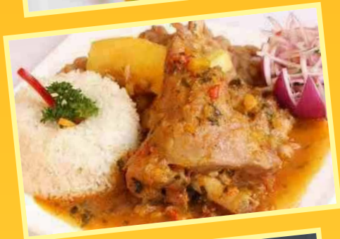
Seco de Cabrito (Sábados y Domingos)