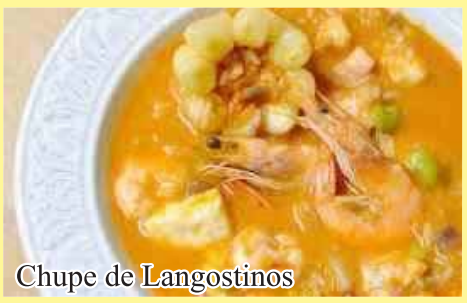
Chupe de Langostinos