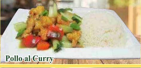
Pollo al Curry