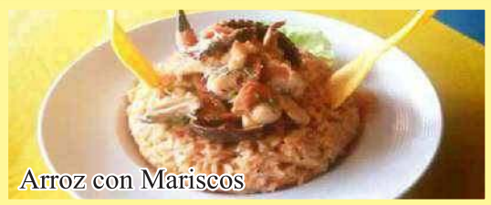
Arroz con Mariscos