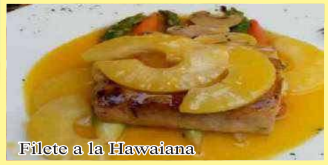
Filete a la Hawaiana

* Opción si desea filete de Corvina o Lenguado costo adicional: