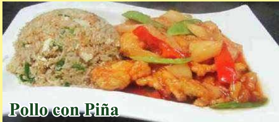
Pollo con Piña