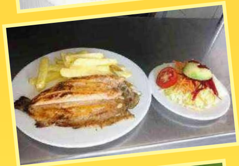
Trucha a la Parrilla (papas fritas + ensalada)