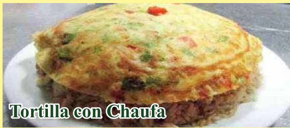
Tortilla con Chaufa