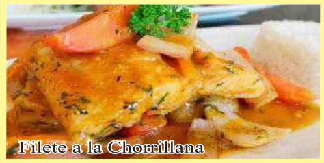
Filete a la Chorrillana

Filete de Pescado en su salsa a la Chorrillana (Arroz blanco y yuca frita).