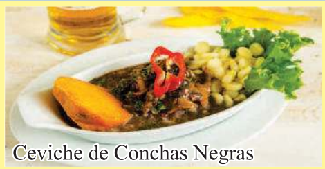
Ceviche de Conchas Negras