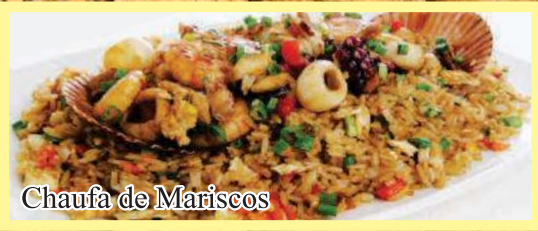
Chaufa de Mariscos