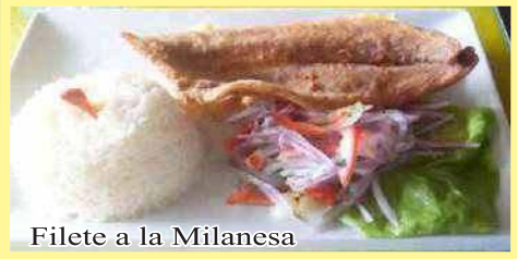
Filete a la Milanesa

Filete de Pescado en su salsa a lo Macho (Arroz blanco y yuca frita).