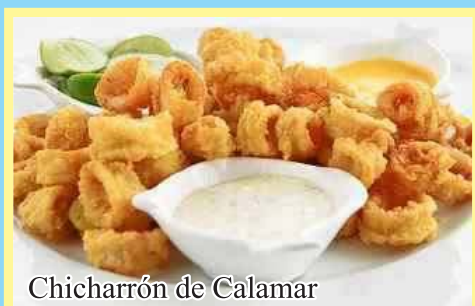
Chicharrón de Calamar