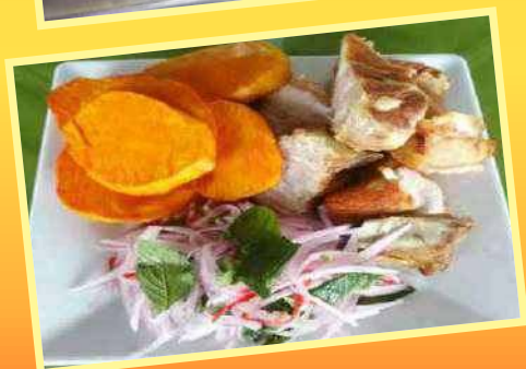
Chicharrón de chancho (camote, sarsa criolla)