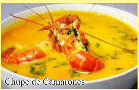
Chupe de Camarones