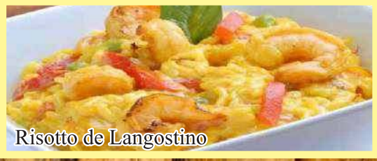
Risotto de Langostino