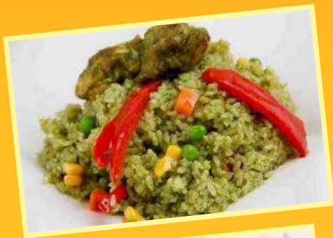
Arroz con Pato (Sábados y Domingos)